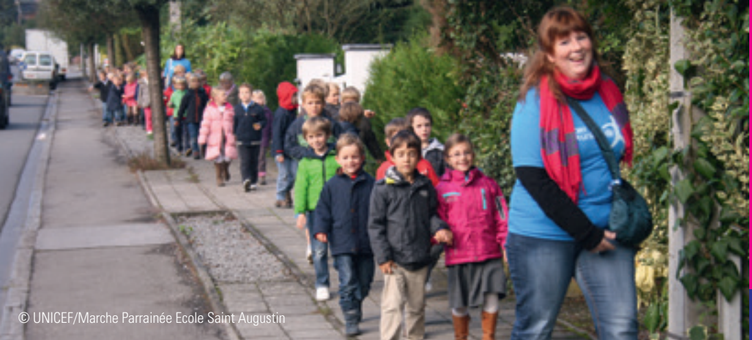
© UNICEF/Marche Parrainée Ecole Saint Augustin